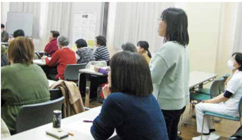
質問や感想が飛び交う活気ある報告会