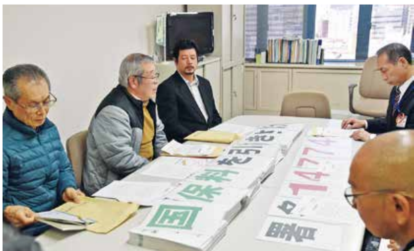
国保料引き下げの願いがこもった14,774筆の署名の前での懇談

☆今年は野菜が安くてものがあるので、小松菜、キャベツ、いんげん、菜の花などでも試してみてください！