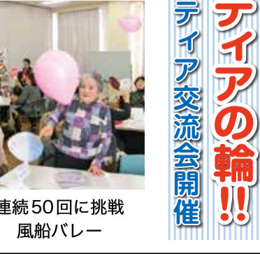
連続50回に挑戦 風船パレード

広がれボランティアの輪!! ボランティア交流会開催 岡山医療生協では地域のサロンや事業所での健康のお茶出し、花壇の手入れ、患者さんの案内、あるいは託児などたくさんの方々がボランティアとして活躍しています。 1月31日(金)、そんなボランティアさんの交流会を開催しました。参加者は54人でした。 お楽しみ会は、歌いながら手を動かす「カエルの夜回り」、テーブルの上を走る(紙製の)「ゴキブリ叩き」、うちわを持っての「風船パレード」などでした。テーブルの上を走る「ゴキブリ叩き」、うちわを持っての「風船パレード」をめぐりながら50人以上のラリーをしました。 交流会ではグループに分かれて活動の報告を行い、とても活発な話し合いができました。 感想では「他のサロンの話が聞けてよかった」「お楽しみ会の内容は自分の支部やサロンでもできそう」「子どもも高齢化と後継者不足の心配があるよ」「うだ」といった内容が寄せられています。中には「ボランティアをしてみたい」といううれしい感想もありました。 初めて参加した方もおられ、ボランティアの輪がもっともつとひろがればいいなと思う一日でした。 ボランティア委員会 溝口初美