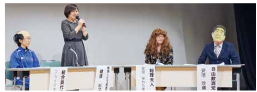
時事風刺劇(岡山協立病院)