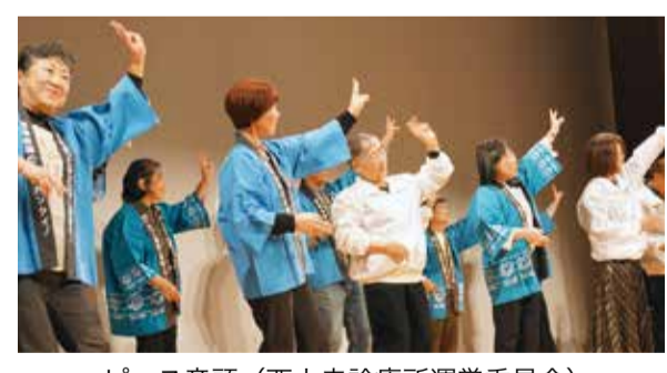
ピース音頭(西大寺診療所運営委員会)