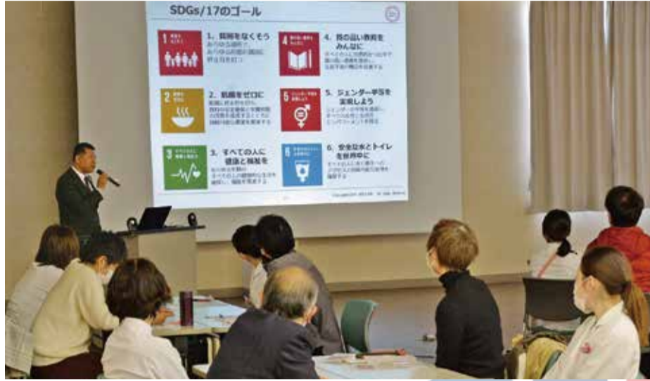
「なぜSDGsが私たちの世界に必要なのか」カードゲームで体験 (2/19 コムコム会館)

●組合員数 68,281人 ●出資金19億1,296万円 ●1人平均出資金 28,016円 (2020年2月25日現在)