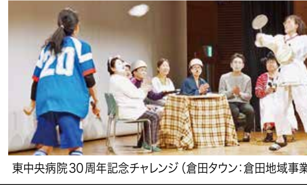
東中央病院30周年記念チャレンジ(倉田タウン・倉田地域事業所の愛称)