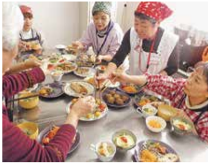
卒業メニュー試食会

最近の活動では子どもと関わる機会が多くなってきているという声もあり、今回は「子どもが喜ぶメニュー」を考えました。「アジのハンバーグ」や「鮭とレタスのチャーハン」など、苦手な魚や野菜をおいしく食べられる工夫がありました。