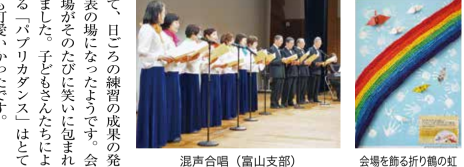
会場を飾る折り鶴の虹