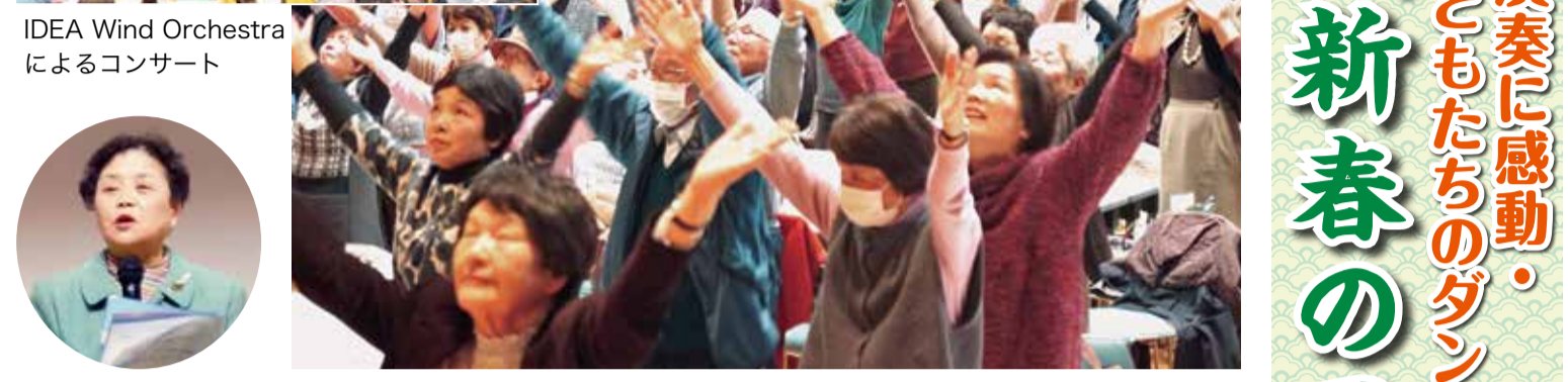
住友実行委員長 参加者全員でスッキリはげばれ体操

「2020年岡山医療生協新春のつどい」が2月16日、コンベンションホールにて約420人の参加で賑やかに開催されました。 オープニングは「IDEA Wind Orchestra」による胸に響く生演奏でした。普段目に見えない楽器もあり、演奏者のみなさんから楽器説明してもらい、とても感動しました。仲間増やし、出資金ふやしの目標達成に向けた力強い訴えもありました。 また、国連本部で開催される「核兵器廃絶に向けた再検討会議」の参加者から募金の呼びかけを行い、9万9390円が寄せられました。(6面に関連記事) 午後から組合員・職員による7つの出し物があり、みなさんそれぞれ、工夫されています。 「パブリカダンス」はとても可愛いかったです。 外の展示フロアでの展示品は、支部や事業所を含めて16か所の展示があり、サロン・健康チェック・小物作り・ヘルパーの学習会・患者さんへの「ささき愛」サービなどなど、今まで取り組んだ内容で、工夫をこらした盛り沢山の発表になっていました。 屋外は一日雨でしたが会場内は熱気であふれていて、楽しい一日になりました。