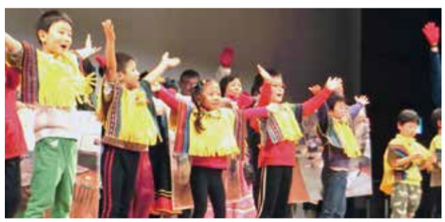
パブリカダンス(東エリアとみんなの診療所運営委員会)