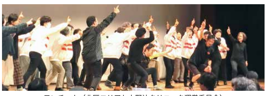
ワンチーム(北区エリアと大野社クリニック運営委員会)