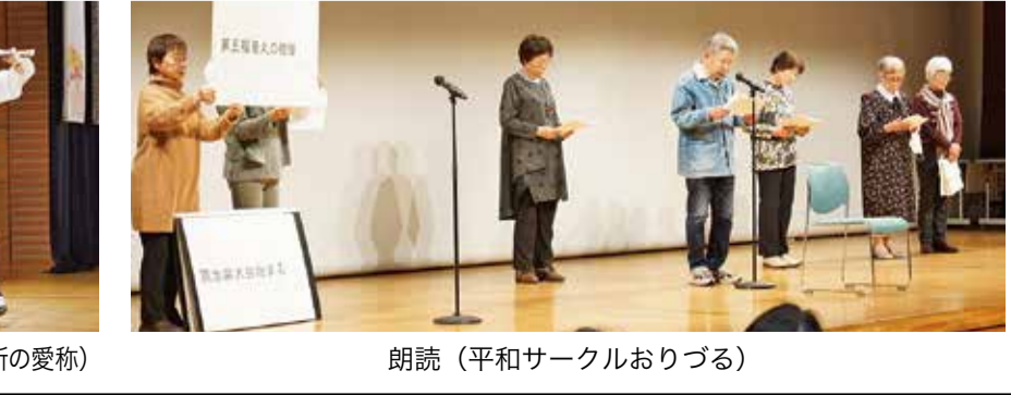
朗読(平和サークルおびる)