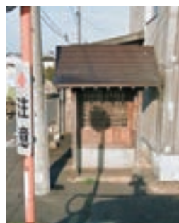
▲ 沖新田第四十八番札所

沖新田八十八ヶ所第四十八番札所は、山陽新聞光政販売所から百間川と反対方向に歩き、最初の十字路の左側にある茶色い屋根の祠です。歩いてきた道をそのまままっすぐ進むと県道383号線に出ることが出来ます。