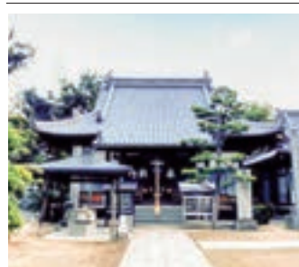
▲ 四国八十八ヶ所霊場第四十八番札所 清滝山 安養院 西林寺

西林寺の見所は、祈願すると一つだけ願いを叶えてくれるという「一願地藏」と本堂と大師堂の間にある閻魔堂です。お寺の近くには杖ノ淵といわれる湧き水が出ている公園があります。今から1200年前湯きに耐えかねた弘法大師がこの地を訪れた際、持っていた杖を地面