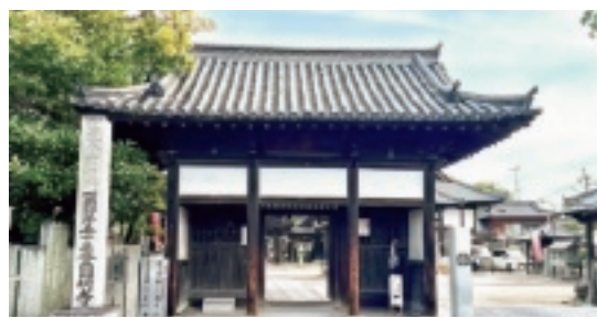
▲ 四国八十八ヶ所霊場第五十三番札所 須賀山 正智院 圓明寺

また、この灯籠にはマリア像が刻まれており、当時このお寺のように隠れキリシタンの為に、マリア像だが観音様(マリア観音)としてお寺に安置し、秘仏として保管されている札所もあります。他にもアメリカ人巡礼者が発見した四国霊場最古の銅板納札が保存されていたり、左甚五郎作といわれる籠