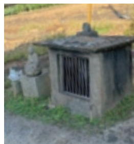
▲ 沖新田第五十三番札所

また、この灯籠にはマリア像が刻まれており、当時このお寺のように隠れキリシタンの為に、マリア像だが観音様(マリア観音)としてお寺に安置し、秘仏として保管されている札所もあります。他にもアメリカ人巡礼者が発見した四国霊場最古の銅板納札が保存されていたり、左甚五郎作といわれる籠