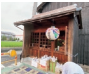
▲ 沖田新田第十八番札所