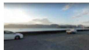
▲車道から見える児島湾と夕日