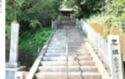
▲四国八十八ヶ所 第二十六番札所 龍頭山 光明院 金剛頂寺

今回は沖新田第二十六番札所の紹介です。沖新田第二十六番札所は、二十五番札所から百間川の水門を渡りきって土手の道と湾沿いの道の角にあります。車道沿いにあり、ここから見る夕方の湾は、とても綺麗で、児島大橋も見えインスタ映えのする好きな風景の一つです。