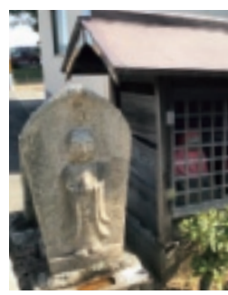
▲ 沖新田第三十四番札所

す。国の重要文化財に指定されている毎年3月8日に御開帳されるので、お目にかかれる機会が多いです。種間寺は安産祈願で有名なお寺です。見どころの一つ「子育て観音」はシンボリック存在で、左手に赤ちゃんを抱いている優しい顔をさ