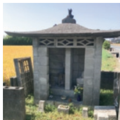
▲ 沖新田第三十五番札所

子どもたちにとって絵本はまるで宝宝箱のようです。ページをめくるとキラキラ輝く物語が始まります。そんな子ども時代を振り返ると、きっとあなたにも心に残っている1冊があると思います。是非親子で共有してみてください。ちなみに私は「おいしいのぼうけん」が大好きで親子でもう一度読みたくなりました。