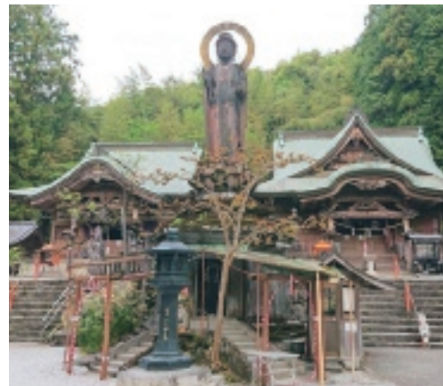
▲ 四国八十八ヶ所第三十五番札所 醫王山 鏡池院 清瀧寺