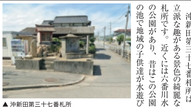
▲ 沖新田第三十七番札所