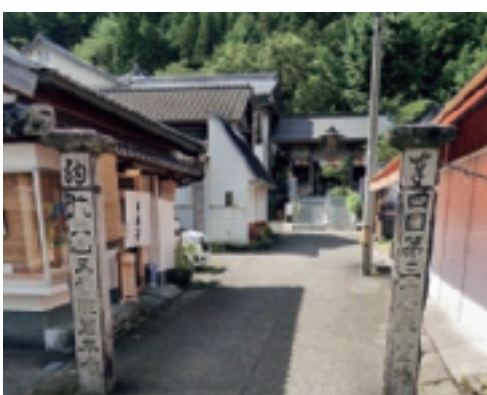
▲ 四国八十八ヶ所第三十七番札所 藤井山 五智院 岩本寺

沖新田第三十七番札所は、立派な趣がある景色の綺麗な札所です。近くには六番川水の池で地域の子供達が水遊び