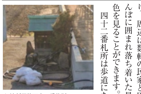
▲ 沖新田第四十二番札所

沖新田八十八ヶ所第四十二番札所は、前回の四十二番札所の通りの近くにあります。周辺は数軒の民家と田んぼに囲まれ落ち着いた景色を見ることが出来ます。四十二番札所は歩道にあり、周囲は数軒の民家と田んぼに囲まれ落ち着いた景色を見ることが出来ます。四十二番札所は歩道にあり、周囲は数軒の民家と田んぼに囲まれ落ち着いた景色を見ることが出来ます。