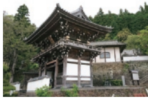
▲ 四国八十八ヶ所第四十二番札所 一カ山 毘盧舎那院 佛木寺

沖新田八十八ヶ所第四十二番札所は、前回の四十二番札所の通りの近くにあります。周辺は数軒の民家と田んぼに囲まれ落ち着いた景色を見ることが出来ます。四十二番札所は歩道にあり、周囲は数軒の民家と田んぼに囲まれ落ち着いた景色を見ることが出来ます。四十二番札所は歩道にあり、周囲は数軒の民家と田んぼに囲まれ落ち着いた景色を見ることが出来ます。