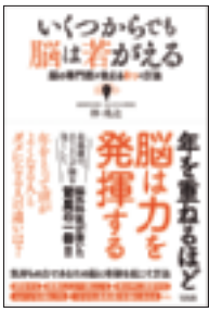
「いくつからでも脳は若がえる」 脳の専門医が教える8つの方法 (宝島社)