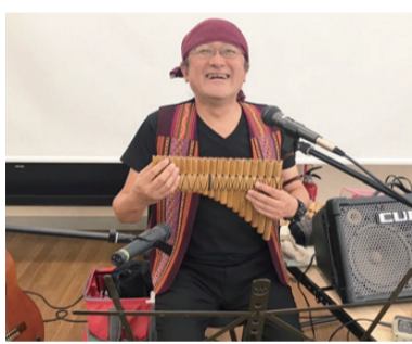
アンコールに沸くパンフルート

ロビーでは、16日(火)から「ヒロシマの高校生が描いた絵画展」が開催され、約150人の方に来場いただきました。