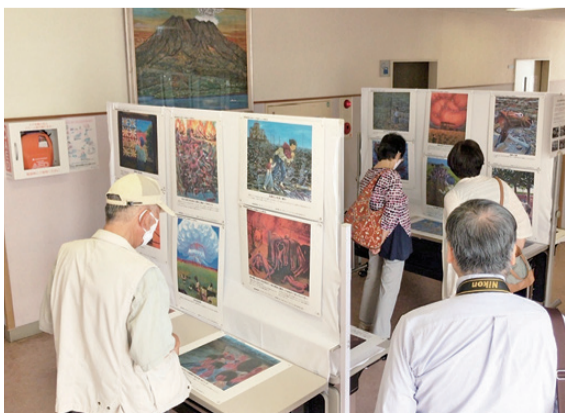
高校生が伝える原爆の記憶