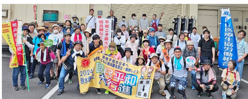
コープ大福店で記念の1枚

進が岡山県に入り、広島県へバトンパスをするまでの間に参加してきました。私にとって平和行進とは