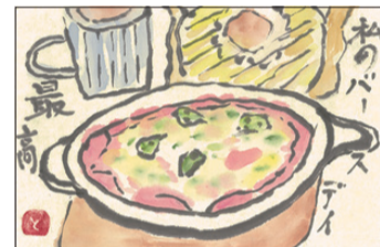
瀬戸内市とつちゃん

瀬戸内市とつちゃん 老化防止に「ザ・クロスワード」に挑戦したり、「食事シリーズ」のレシピを実践したりしている。栄養ポイントを参考に健康につながる食事作りを大切にしていきたい。 岡山市東区 ダリン