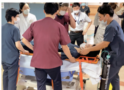
災害時を想定した訓練

今回の訓練は当院の災害時の対応がどのようなものかを知ってもらうため、地域の方や岡山東商業高校にも参加していただきました。訓練を通じて、問題点や情報共有の重要性を再認識しました。また地域の方々からは「早急な対