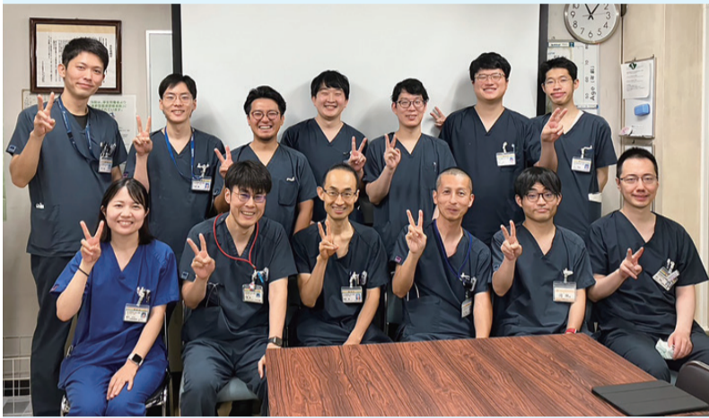
活気あふれる医局

研修医が集まらず、定着が少ない時期もありましたが、目先のことにこだわらず「全国で活躍できる医師を育てよう」と医師のみならず多くの職種で力をあわせて指導してくれました。地域や診療所組合員の方々も大きな力になり、基本的な技量習得とともに、患者さん、その家族に思いが寄せられる心ある医師が育つてきています。こうして研修に関わってくださるスタッフを心から誇りに思っています。またこの数年は総合診療科の充実のおかげで指導体制も厚くなり、2年前の外部審査ではエクセレント賞を受賞しました。もちろん主役は研修医です。2年間とはいえ研修中は山あり、谷あり、彼らが生き生きとしつかりした学びができるよう、引き続き温かい目で見守りながら、ご指導・ご支援をお願いいたします。