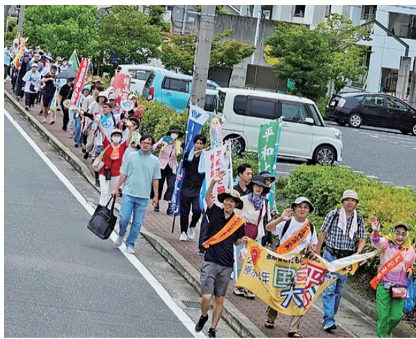
平和を訴えてみんなで行進

7月20日(土)、国民平和行進に参加しました。私が歩いたのは、岡山市南区の西市公園(休憩所)からコープ大福店までの約3kmのコースです。先に北区の下石公園から行進されていた皆さんと合