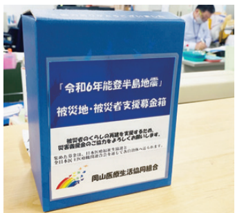
募金箱は各事業所に設置

の入居も徐々に進んでいます。募金箱は各事業所に設置してありますので、引き続きご協力をよろしくお願いたします。