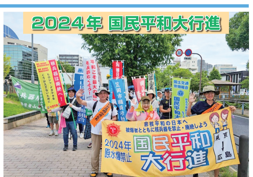
広島へ想いをつなぐ平和行進が7月16日、岡山県へ入って来ました。16日～20日は岡山市内行進で、岡山医療生協の職員・組合員もたくさん参加しました。(関連6面)