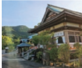
▲ 四国八十八ヶ所第四十七番札所 熊野山 妙見院 八坂寺

八坂寺は四国八十八ヶ所の四十七番札所です。熊野山妙見院と号し、総本山醍醐寺末寺で、真言宗古義派の寺院です。寺伝によると六〇〇年代に修験道の開祖、役行者、小角が開山、大宝元(七〇一)年に文武天皇の勅願所として小千(越智)伊予守玉興が七堂伽藍を建てたといわれています。中世には、紀伊国(和歌山県)から熊野権現が勧請され、十二社権現がまつられて熊野山八坂寺と呼ばれるようになりました。七堂伽藍をはじめ十二の宿坊、四十八の末寺を持つ大寺院で修験道の根本道場として栄え隆盛を極めたといわれています。戦国時代に兵火のため堂宇が灰燼に帰し、後に再興して今の地に