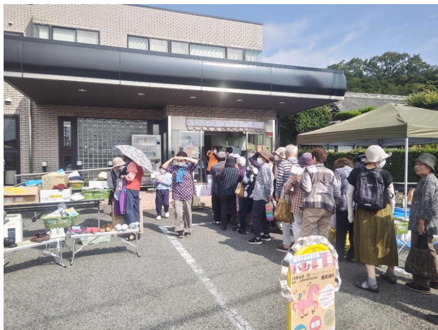
開催前から長蛇の列!!