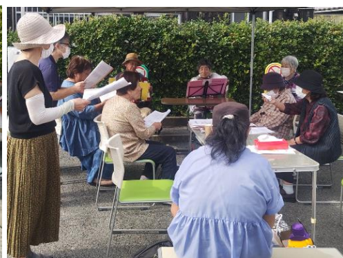
軽やかな伴奏で歌声もはずみます。