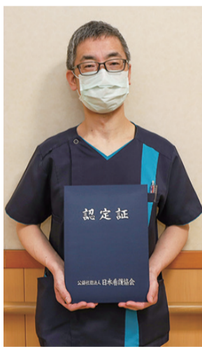
安心・安全な病院へ

岡山協立病院には現在8人の認定看護師がいます。病気の悩みや不安を少しでも軽減できるように、各分野の専門知識を持った認定看護師が患者さんや家族に寄り添いながら援助をしています。また地域の方々からの相談も受けています。