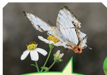
はねの模様が生崖のようなイシガケチョウ

イシガケチョウはイヌビワやイチジク、ツマグロヒョウモンはスミレの仲間（パンジーやビオラ）を好むので観察してみてください。