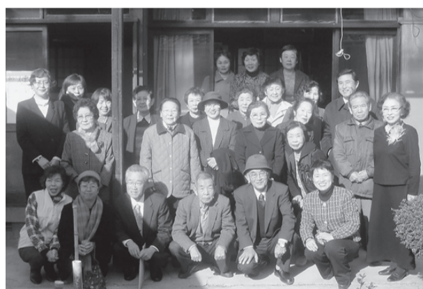
開所時の記念写真(2004年1月)

平井支部が毎月行っているサロン「すまいる」が20年を迎えました。昨年8月の平井支部運営委員会から論議を重ねて記念誌を発行することにしました。サロン「すまいる」は20年前、岡山医療生活協50周年記念事業の健康づくり基金