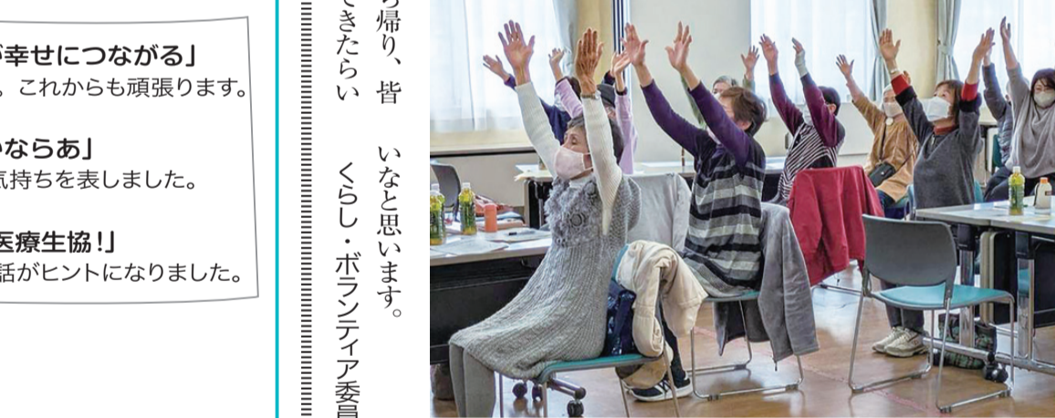
リズム体操でリラックス

次に、瀬戸支部のたまりば「あゆもどき」で行われていた「認知症カフェあゆもどき」の結成と活動の報告がありました。昨年、瀬戸支部のボランティア学校開催中に、岡山市東区の地域包括支援センターから認知症カフェの開催について打診があったそうです。専門家のいない支部で、認知症カフェの運営ができるだろうかという不安はありましたが、地域の小規模多機能ホーム「みえさんち」から専門家を派遣してくれることになり、「認知症カフェあゆもどき」が誕生し活動がスタートしました。