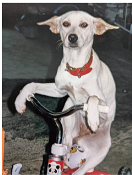
岡山市東区 ラブちゃん