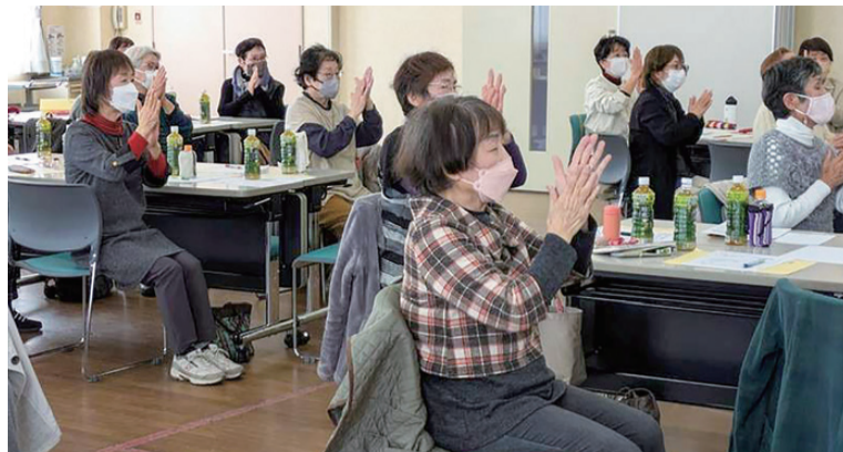
リハビリ体操の体験

ご予約・お問い合わせ先: 健康づくりセンター大野辻 Tel.086-805-0335 健康まちづくりセンター Tel.086-271-7880