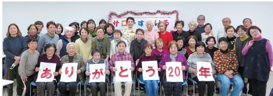
2024年12月のサロンで参加者・スタッフと記念撮影