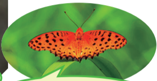
とても鮮やかなオレンジ色のツマグロヒョウモン