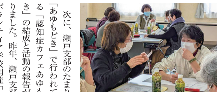
お互いの活動を参考に

3月8日(土) 10時~11時 30分、コムコム会館3階にてボランティア交流会が開かれました。49人の参加でした。