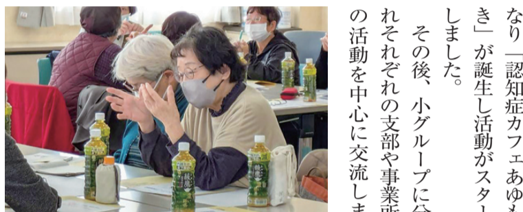
交流を深める参加者

続いて2つのボランティアグループの活動について紹介がありました。まず、協立病院のボランティアグループ「かるがも」さんから、活動報告とスタッフ募集のお願いがありました。「かるがも」さんの主な活動は東玄関の花壇の整備とお誕生日カードの作成です。活動内容を聞いて、当日2人のボランティアさんが誕生しました。