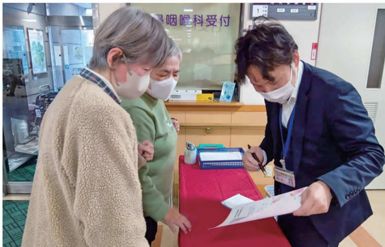
MRI装置更新について説明する職員