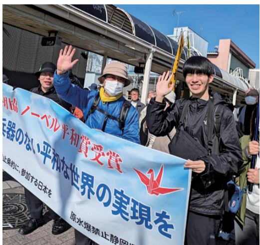
平和行進にも参加