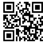
応募はこちらから