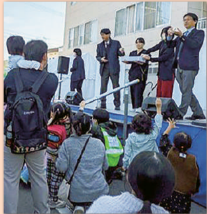
＊笑顔はじける餅まき

来場者からは、「子どもたちがとても楽しそうだった」「医療が身近に感じられた」など感想が多数寄せられました。 「健康フェスティバル」は、「地域とともに歩む病院であり続けたい」という岡山協立病院の理念を形にした取り組みでした。医療機関が日常では見えにくい役割や取り組みを外部に開くことで、安心感や信頼感につながるだけでなく、医療・健康・福祉をより身近に感じていただくきっかけとなりました。 多くの地域団体、提携店、協力企業、そして100人を超える学生ボランティアの皆さんに感謝します。 実行委員会 事務局 草地海翔