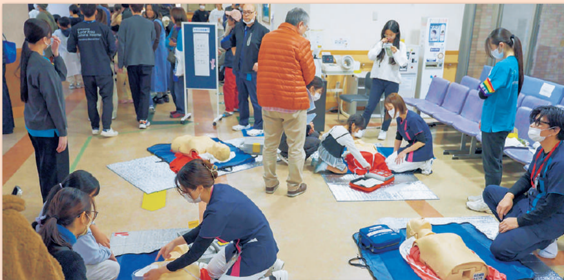
いろいろな医療体験ができるコーナーも (AED体験)