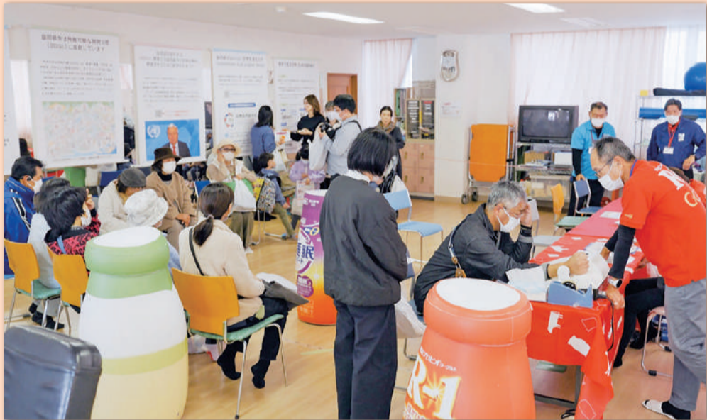
＊健康への関心を高める健康チェック

岡山医療生活協同組合 健康まちづくりセンター 予約TEL：086-271-7880