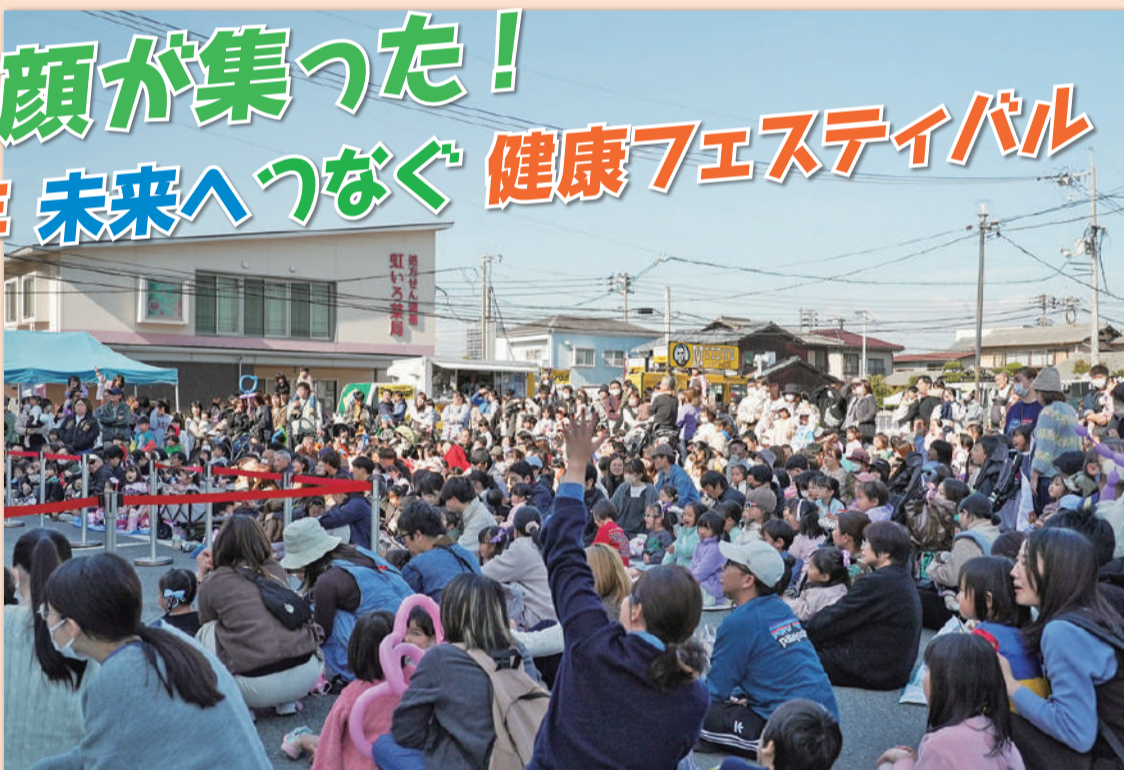
キャラクターショーで盛り上がる大勢の参加者