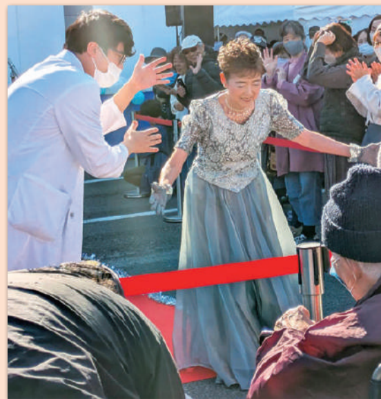
きらり輝くメイクアップファッションショー