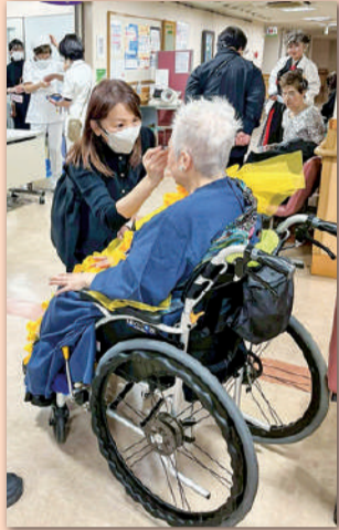
＊メイクセラピーで心豊かに

診察体験、内視鏡体験、聴診体験、AED体験など、医療体験ブースは大盛況となりました。当日は、隣接薬局の薬剤師や学生ボランティアにお手伝いいただき、多彩なプログラムを通して医療の現場を身近に感じる機会となりました。