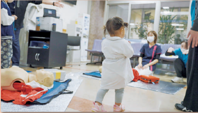
＊病院での医療体験

診察体験、内視鏡体験、聴診体験、AED体験など、医療体験ブースは大盛況となりました。当日は、隣接薬局の薬剤師や学生ボランティアにお手伝いいただき、多彩なプログラムを通して医療の現場を身近に感じる機会となりました。