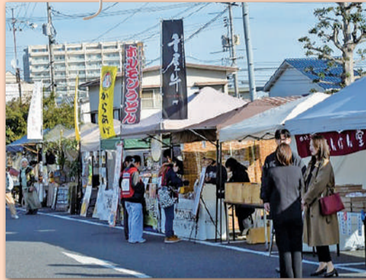
＊絶品グルメが大集合！