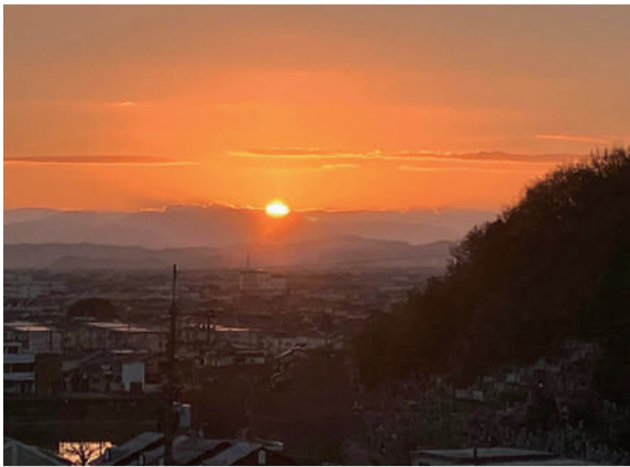
小豆島の初日の出