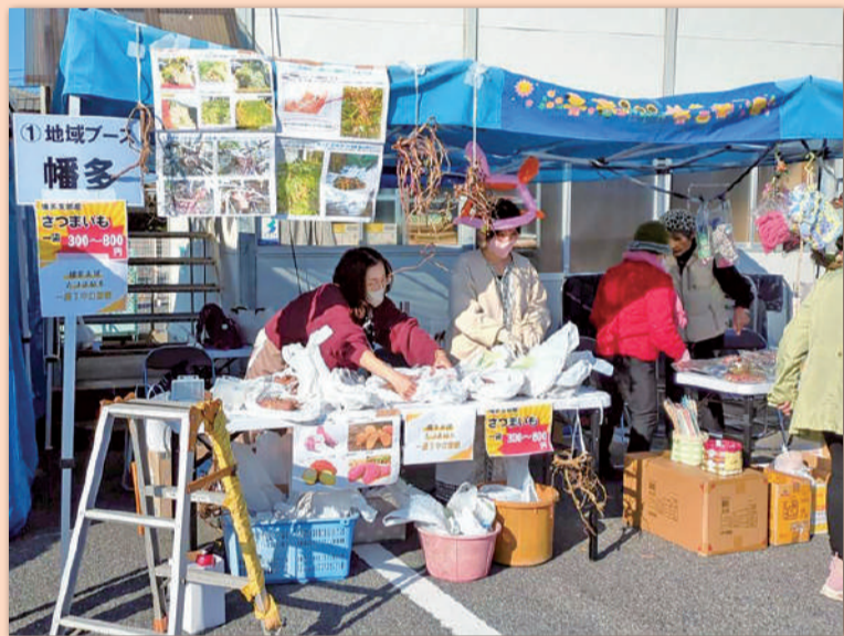
＊組合員もいきいきとバザーコーナー

来場者からは、「子どもたちがとても楽しそうだった」「医療が身近に感じられた」など感想が多数寄せられました。 「健康フェスティバル」は、「地域とともに歩む病院であり続けたい」という岡山協立病院の理念を形にした取り組みでした。医療機関が日常では見えにくい役割や取り組みを外部に開くことで、安心感や信頼感につながるだけでなく、医療・健康・福祉をより身近に感じていただくきっかけとなりました。 多くの地域団体、提携店、協力企業、そして100人を超える学生ボランティアの皆さんに感謝します。 実行委員会 事務局 草地海翔