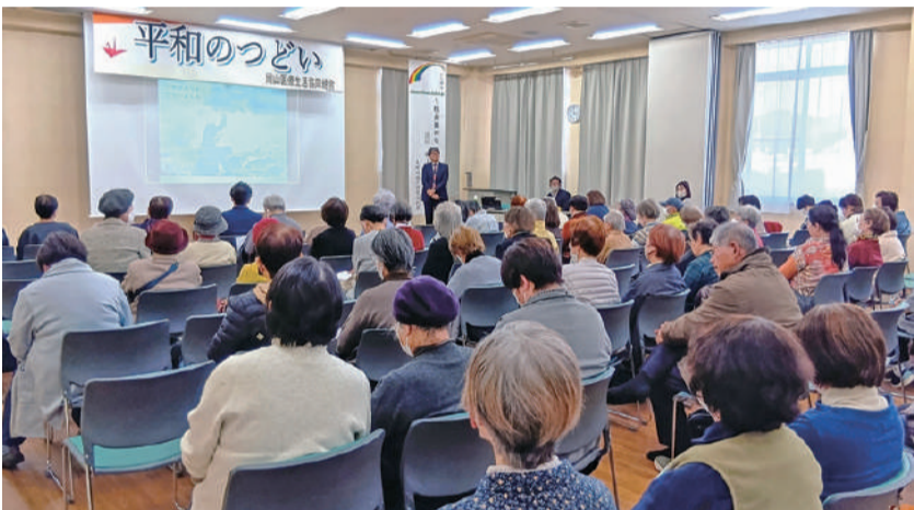
多くの参加者とともに考える

最後にタイトルの「Peace from おかやま」[「Peace from わたし」]を引用し、この岡山の地から核兵器廃絶の声を上げて