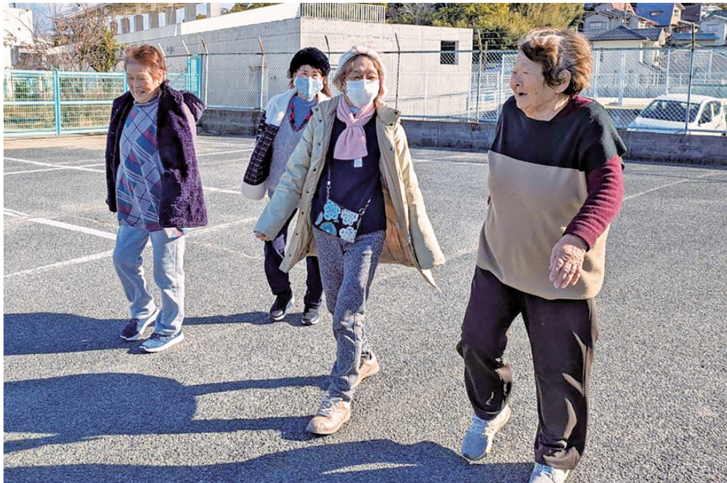
みんなで楽しくウォーキング

いま、岡山医療生協は ●組合員数 59,648人 ●出資金 18億5,770万円 ●1人平均出資金 31,144円 (2026年1月20日現在)