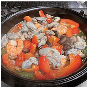
岡山市中区 高橋 淳

「おうちでできる健康づくり」塩麹漬け真鯛のアクアパッツァを早速作ってみました。美味しい!!