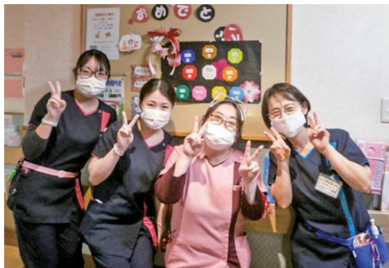
笑顔で看護師がお迎えします