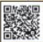
岡山協立病院 「虹のなかま」