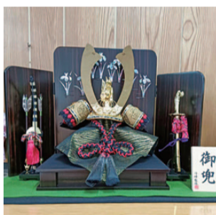
岡山市東区 塩 見

入院中の部屋から、協立病院のテラスの畑が見えて癒されていました。3月号の記事を見て、リハビリスタッフの方が頑張つて取り組みをされていると知って、とても素晴らしいと思いました。 赤磐市 吉實千栄