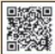
岡山東中央病院 「かりゆし」