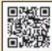
玉野診・みんな診・石大寺診 「診療所だより」