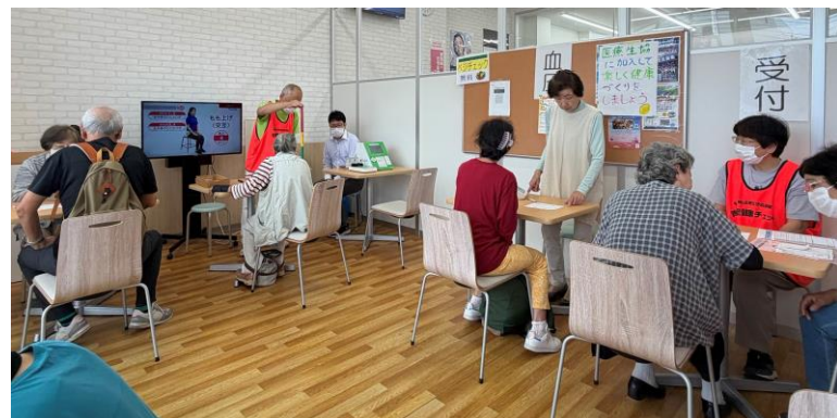
写真：牛窓鹿忍分館研修室での健康チェック