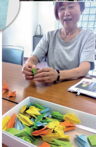
みんなの想いを込めた折り鶴