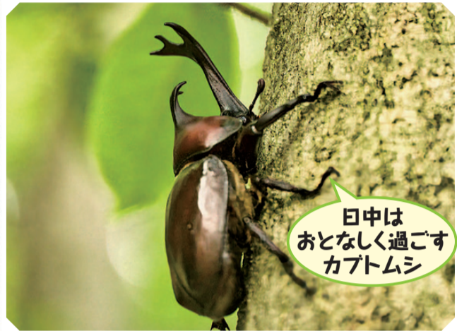
日中は おとなしく過ごす カブトムシ

また、里山環境の変化も心配されています。身近な昆虫の姿は、私たちを取り巻く自然環境の変化を静かに映し出しているのです。