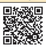
岡山協立病院 「虹のなかま」