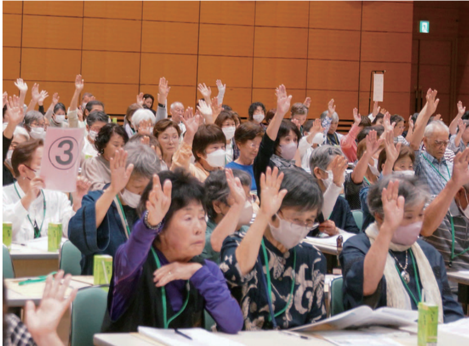
賛成多数ですべての議案が可決

いま、岡山医療生協は ●組合員数 58,414人 ●出資金17億9,846万円 ●1人平均出資金 30,788円 (2026年6月22日現在)