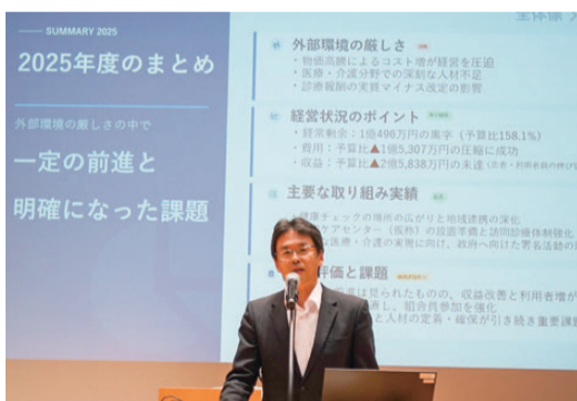
思いを込めて提案

不安が大きい時代だからこそ、支え合う力が必ずあります。一人では難しいことも、地域のみなさんと手をとり合えば乗り越えることができます。