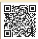
岡山東中央病院 「かりゆし」