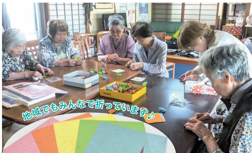
地域でもみんなで折っています♪

循環型の取り組みのひとつに、コープCSネットが行っている「平和の折り鶴昇華再生事業」があります。この事業は、寄せられた折り鶴を再生紙としてよみがえらせ、カレンダーやノートなどに形を変えて循環させています。そ