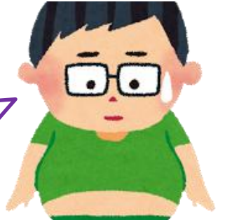
内臓脂肪CTを受けようか悩む青年