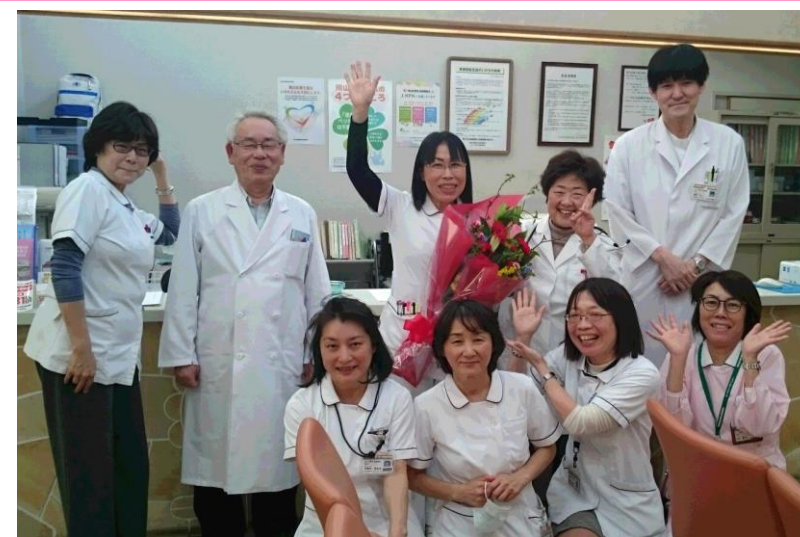
西大寺診療所 3人の先生と根本師長