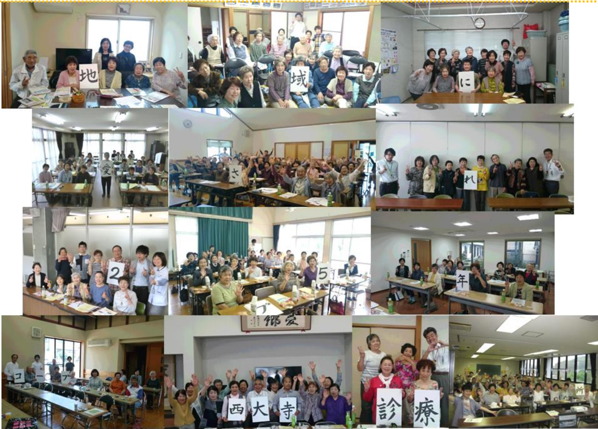
今ががんばりどき ふんばりどき こころひとつに コープ西大寺診療所 (写真は2018年4.5月でお邪魔した様子です)