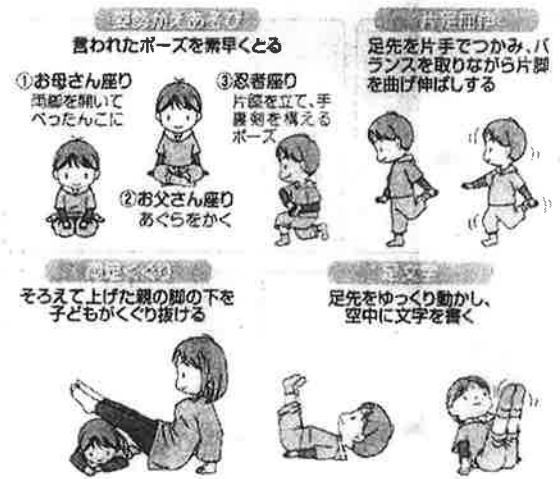
山陽新聞 2020, 4, 3 (金) 朝刊