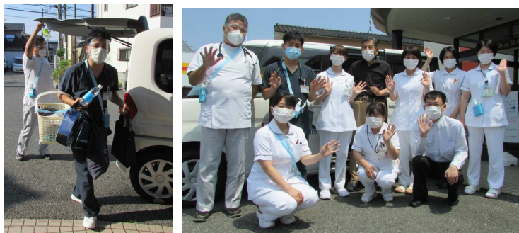
さい。よろしくお願いたします。